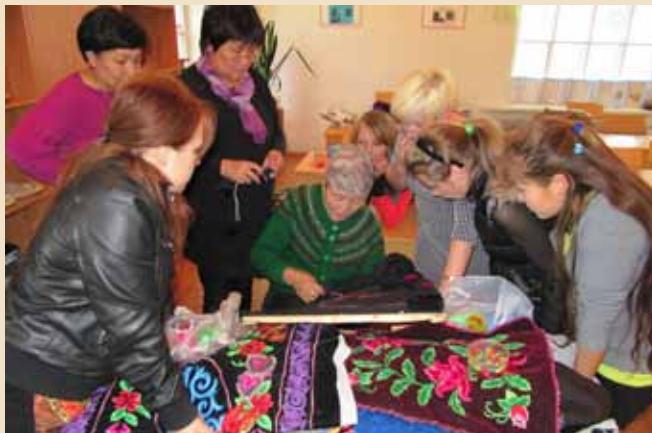
Семинар по национальной казахской вышивке

группами ознакомились с уже действующим гостевым домом «У Михалыча» и даже ненадолго почувствовали себя в нем туристами.