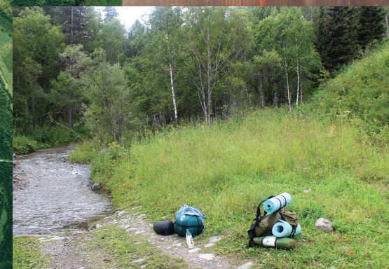
Дорога к озеру