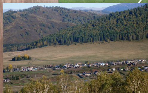
Вид с Ничихи на село