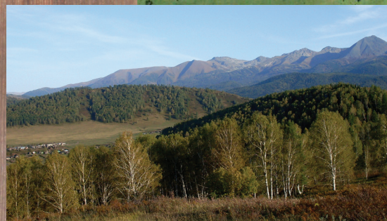
Вид на Ивановский хребет