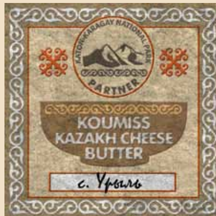
Этикетка для Катон-Карагайского кумыса, сыра и масла из с. Урьиль