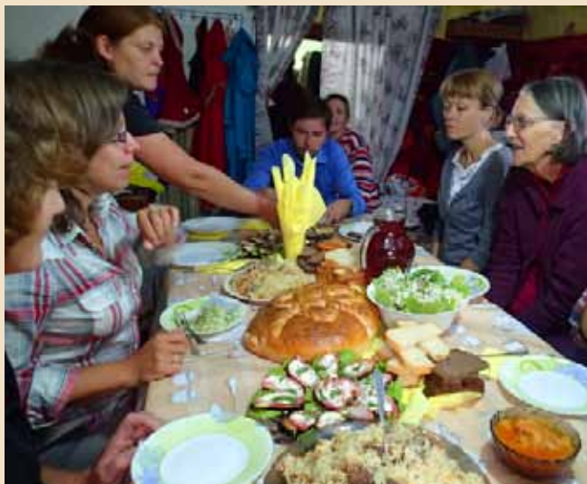
Участники экспедиции и туристка из Австралии были в восторге от местных угощений