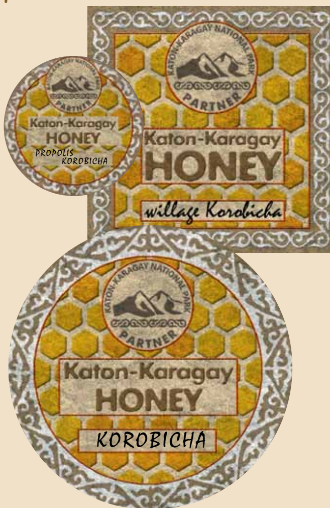
Этикетки для коробихинского меда