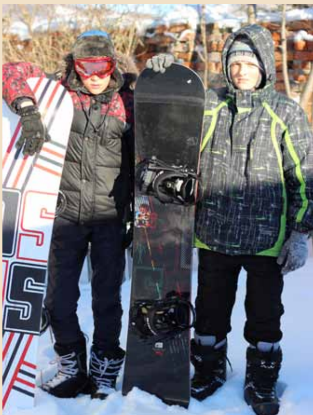
В рамках проекта был приобретен инвентарь для зимнего спорта и туризма в с. Поперечное