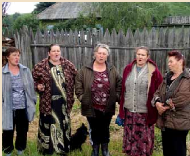
Фольклорная группа села Поперечное

Предложения по развитию туризма (основные предложения начнут реализовываться в рамках проекта):