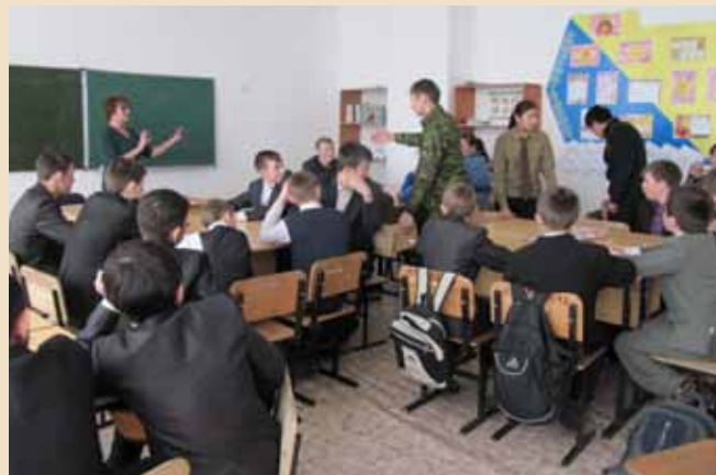
Семинар «Юный экскурсовод»

Наконец, уже в январе нынешнего года в селах Катон-Карагайского района прошли семинары по изготовлению вязаной сувенирной продукции и подарочных изделий из войлока и ковроткачеству . Для них были закуплены необходимые инструменты и материалы, достаточные для изготовления первой партии изделий. Опытные рукодельницы поделились навыками по изготовлению шарфов, тапочек, нанесению орнамента на основу войлочных изделий... Туристы всегда охотно покупают шерстяные носки, вязаные тапочки и сапожки – прохладно в горной местности по вечерам! Да и красивые