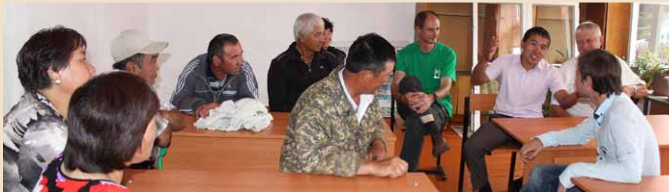
Встреча с местными жителями и акимом в селе Ак Марал