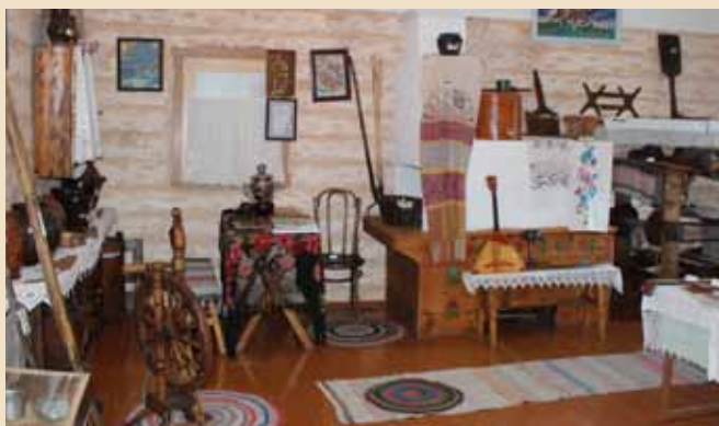
Фрагмент музея в Коробихе