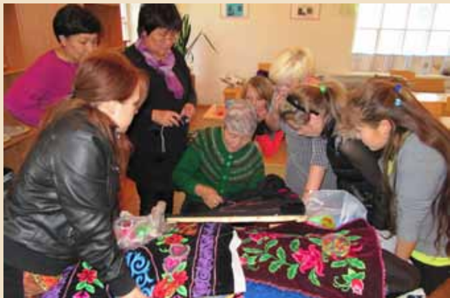
Семинар по национальной казахской вышивке

группами ознакомились с уже действующим гостевым домом «У Михалыча» и даже ненадолго почувствовали себя в нем туристами.