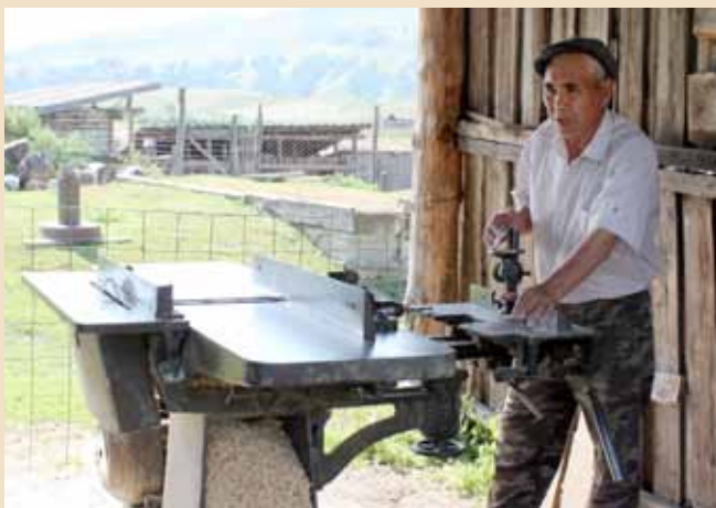
Мастер плотник и столяр в селе Ак Марал