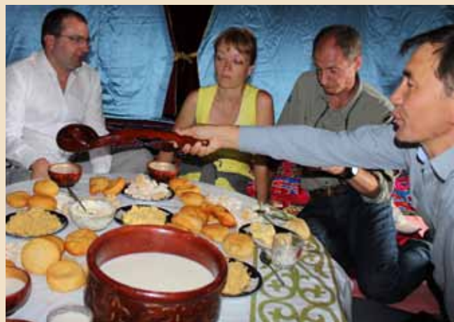
Топ Каин: в гостевой юрте у акима