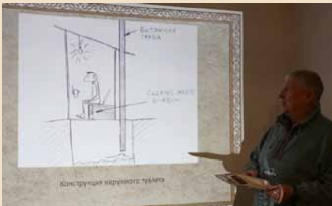
Семинар и тренинг по обустройству гостевых домов: теоретические и практические занятия: как устроить сельский туалет и кладовку с туристическим снаряжением

А в декабре в селе Урыль НКО «Эко-Алтай» организовало семинар и тренинг по обустройству сельского гостевого дома. Все участники семинара получили методическое пособие «Руководство по организации гостевого дома», подготовленное НКО, а затем желающие малыми