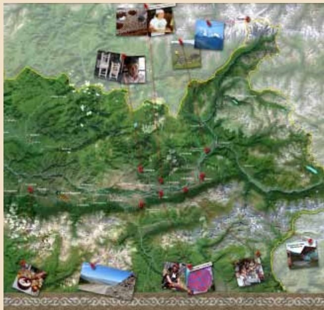
Начало работы над заполнением карты Катон-Карагайского парка, где будут показаны наиболее интересные туристические объекты, адреса мастеров народных промыслов и традиционной кухни, производители экологически чистых продуктов. Фрагмент карты.

На основе примера Национального парка Gesäuse (Австрия) была разработана программа партнерства для развития сельского туризма в Катон-Карагайском национальном парке. Она базируется на взаимном контроле качества предоставляемых услуг, и общей политике про-