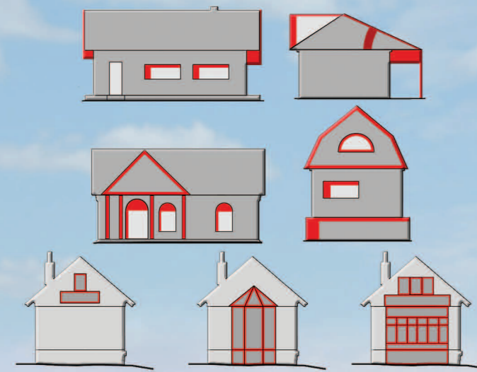
Недопустимые варианты конструкции домов