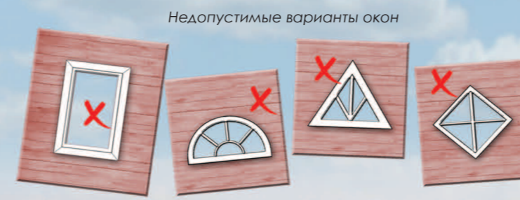
Недопустимые варианты окон

Невозможно использование пластиковых окон без расстекловки, слуховых окон нетрадиционной формы и мансардных окон типа «велюкс» на главных фасадах.