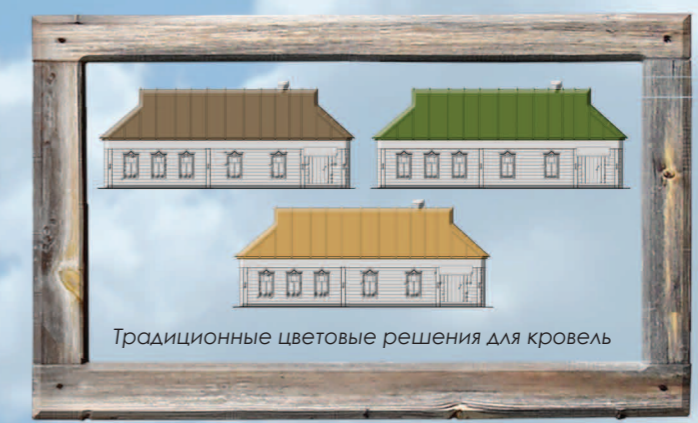
Традиционные цветовые решения для кровель

Цветовая гамма кровель традиционных домов включает спокойные тона зеленой, коричневой, желтой и серой палитр. Недопустима окраска кровель в яркие тона этих палитр, а также в любые оттенки синей, красной, оранжевой, фиолетовой палитр, белый, черный цвета и различные варианты цвета «металлик»