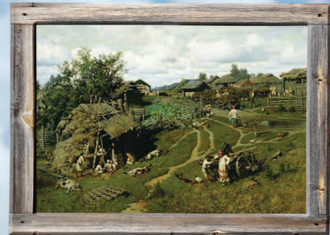
Фрагмент картины П.А. Суходольского "Поле в деревне" (Деревня Желны Калужской губ.), 1864