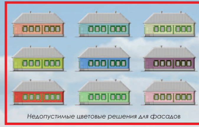
Недопустимые цветовые решения для фасадов

Цоколя выполняют из натурального камня, кирпича с оштукатуриванием, возможна обшивка деревом. Для цоколей применяют цвета натуральных материалов, в случае их окраски – придерживаются основной цветовой гаммы фасада.