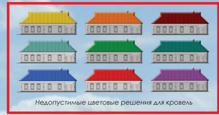
Недопустимые цветовые решения для кровель

Цветовая гамма кровель традиционных домов включает спокойные тона зеленой, коричневой, желтой и серой палитр. Недопустима окраска кровель в яркие тона этих палитр, а также в любые оттенки синей, красной, оранжевой, фиолетовой палитр, белый, черный цвета и различные варианты цвета «металлик»