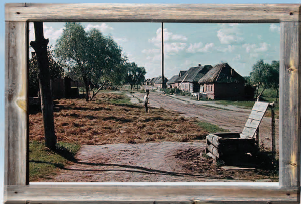
Фотохроника 1942-43 гг. Асмус Реммер