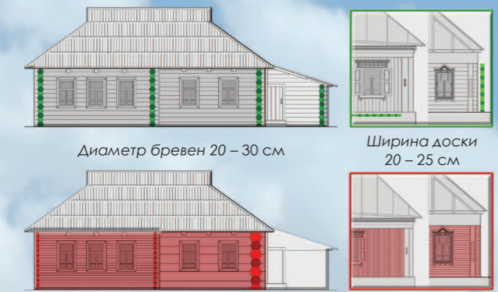
Диаметр бревен 20 – 30 см