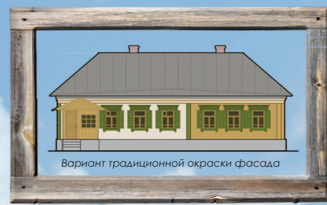
Вариант традиционной окраски фасада

Действенным инструментом регулирования правовых отношений в сфере землепользования и градостроительства являются обязательные Правила землепользования и застройки (ПЗЗ) как нормативный юридический акт. Застройка и землепользование на территории национального парка осуществляются в соответствии с режимом особой охраны территории и должны быть согласованы с дирекцией национального парка. Разрешение на строительство выдается Министерством природных ресурсов и экологии Российской Федерации.