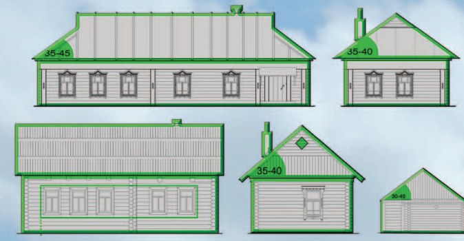
Традиционные конструкции домов и хозблока

Для сохранения традиционной застройки недопустимыми вариантами композиционных приемов и архитектурных форм являются: