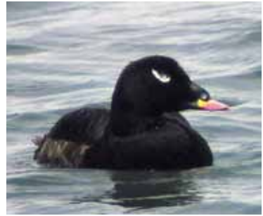
Горбоносый турпан

Далее одна тропа уходит к перевалу Маметек (2700 м. н.у.м.), другая к перевалу Кызылкум (2620 м. н.у.м.). Через эти перевалы местные жители на конях отправляются к озеру Маркаколь и истокам реки Курчум. Тропа, идущая через перевал Кызылкум, более предпочитаема для передвижения, более живописна и более доступна для туристов. Поэтому туристы сворачивают налево и идут по направлению к перевалу Кызылкум. Пройдя 3 км. от развилки туристы могут свернуть на радиальную тропу и посетить озеро Турпанье.